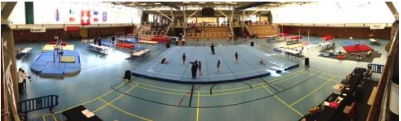
Salle d'entraînement GAM et GAF